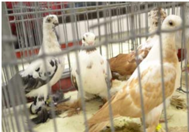
Polske Kortnebbede tommer fra Marek Galicki.