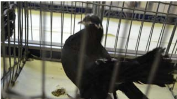
Sort noe broget i fargen, men egentlig med god hale fra Kenneth Stensrud.