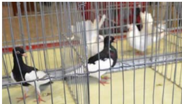
Sorte Skade Purzler fra Willy Hansen..