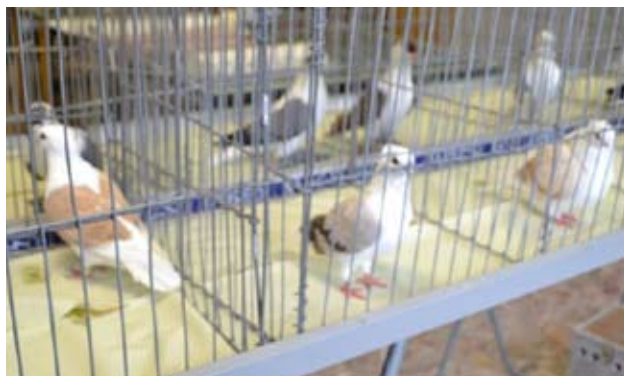
Gul, rødbåndet og gulbåndet Norsk Petent fra Svend Rostad.