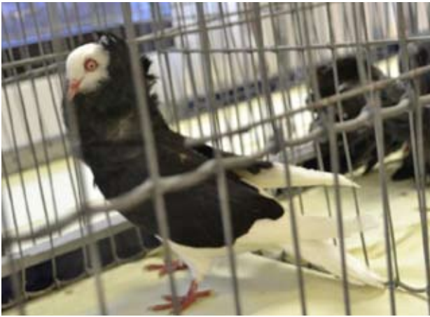
Sort Gammel Hollandsk Kapuziner fra Victor Mongstad-Waage